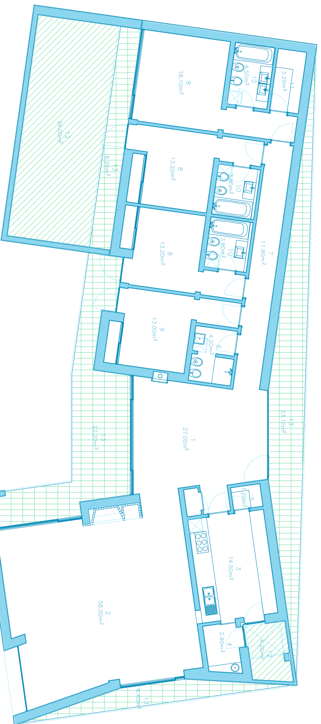
PLANTA PISO 0